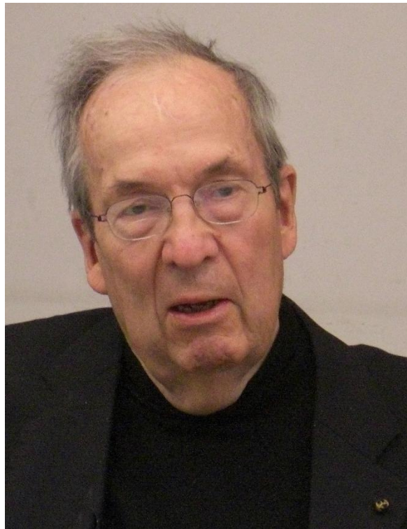
Professor Dr. h.c. Manfred Rommel 24. Dezember 1928 – 7. November 2013

Das Deutsch-Türkische Forum Stuttgart trauert um seinen Ehrenvorsitzenden